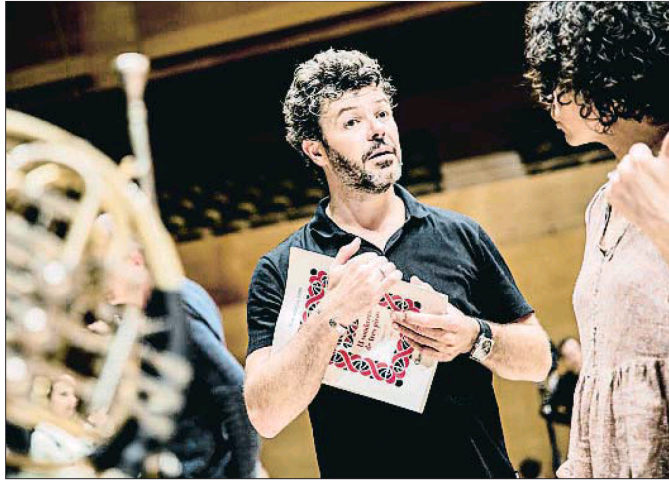
El maestro granadino después del ensayo del Sombrero de tres picos en L'Auditori

ARQUITECTURA ▶ El arquitecto barcelonés Josep Lluís Mateo es el autor de la sede del campus Creatif ESMA, en Montpellier. Esta escuela superior de oficios artísticos es una institución especializada en la enseñanza de videojuegos, animación 3D, efectos especiales, escenografía, etcétera, con sedes en Francia y Canadá, y próximamente en Barcelona, en un edificio proyectado también por Mateo. Hace un par de semanas se colocó la primera piedra del Campus ESMA de Montpellier, en una ceremonia presidida por el alcalde de la ciudad. El fin de las obras está previsto para el verano del 2020. / Redacción